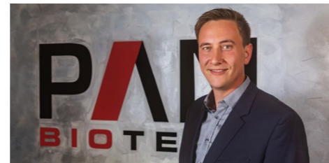
Francis Voirol Givaudan Switzerland Ltd

«Nach meinem ersten Kontakt mit Chemie Brunswig vor ca. 8 Jahren bin ich immer noch davon beeindruckt zu sehen, dass Business mehr sein kann als nur eine Zusammenarbeit. Ich schätze ihren Geist sehr und gratuliere zum 75-Jahr-Jubiläum»